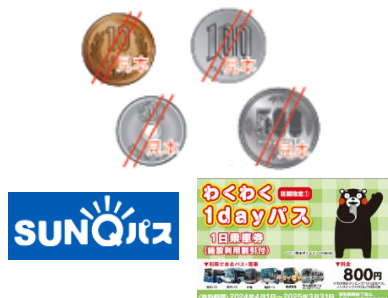
現金・各種乗車券