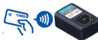
タッチ決済 (空港リムジン等の一部路線)