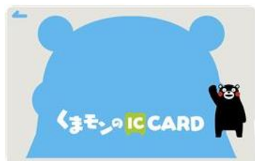
くまモンのICカード